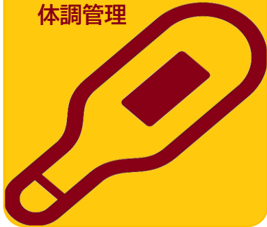
スタッフの検温 体調管理