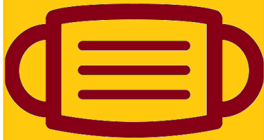
スタッフのマスク着用